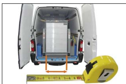
S958 Larghezza del pianale non standard (barriere laterali = non standard)