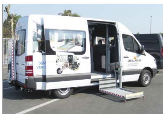
DH-P11 250 kg