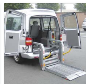
S953 Pianale ripiegabile verticalmente che consente un passaggio completamente libero da ostacoli (modello riportato = DH-P20, DH-P21 esclude le barriere di sicurezza)