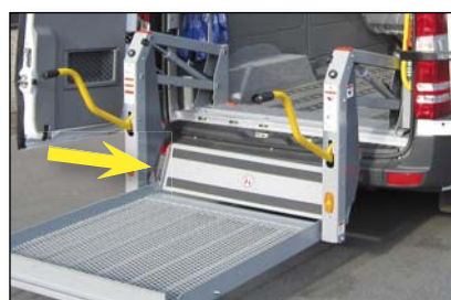
S955 Lamiera di transito montato sul pianale (barriere laterali = non standard)