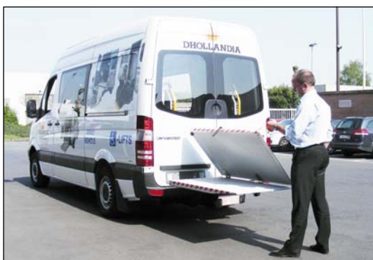
DH-LSPZ 300-500 kg