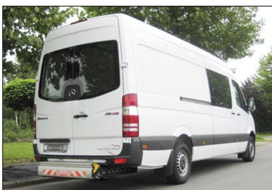
DH-C 350 kg