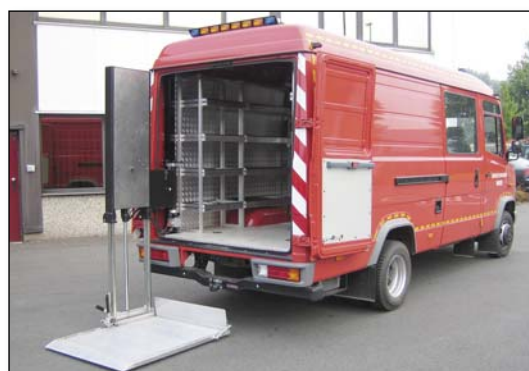
DH-VZ 300 kg