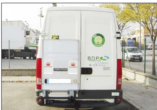
DH-LCZ 500-750 kg