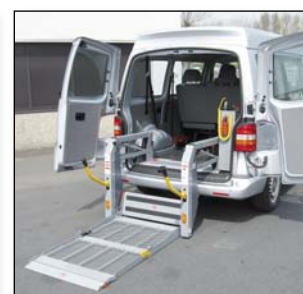
S957 Piattaforma ripiegabile per ridurre l'altezza di montaggio prevista e per assicurare al conducente la massima visibilità attraverso le porte posteriori del veicolo (modello riportato = DH-P20, DH-P21 esclude le barriere di sicurezza)