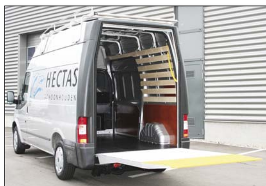
Opzione S604 Senza porte posteriori