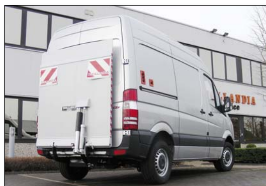
DH-LSP 300-500 kg