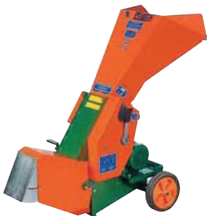
ProfiHäcksler 300K1 E7,5-H