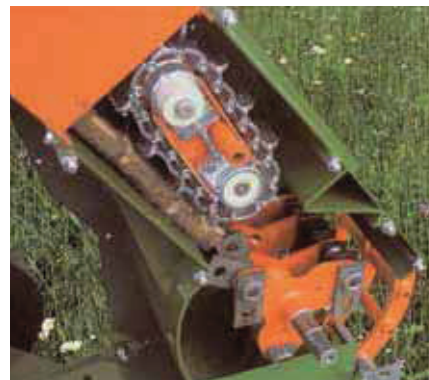
Funktionsweise des ProfiHäcksler 300K1