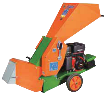
ProfiHäcksler 300K1 B9,7-H