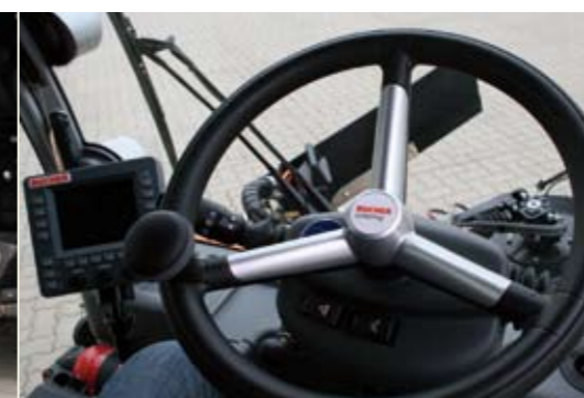
Übersicht und Beinfreiheit

Breitreifen verteilen das geringe Gewicht der CC2020 Light optimal auf dem Boden. Diese Option sichert schonende, Einsätze auf öffentlichen Verkehrsflächen.