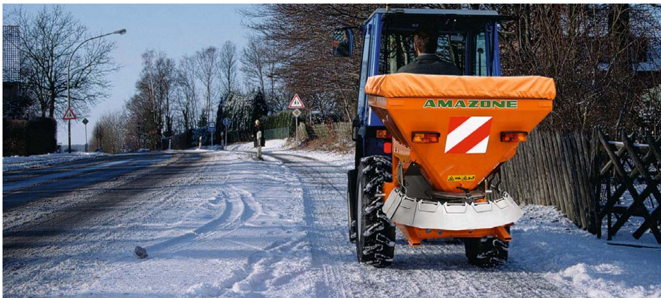
Přesná aplikace písku, soli nebo štěrku i na chodnících a stezkách pro cyklisty.

Obrázky, obsah a technické údaje jsou nezávazné! Vyobrazené stroje se mohou lišit od národních dopravních předpisů. Předepsané dopravní označení si prosím vyhledejte v návodu na obsluhu.