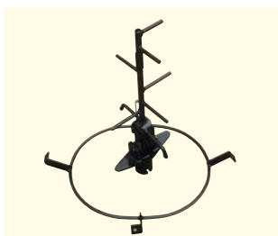
Prstový čechrač na písek a sůl