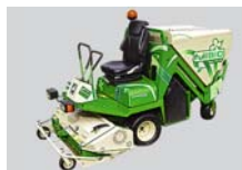
Žací stroj Profihopper a provzdušňovač se sběracím zařízením