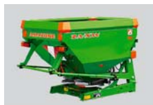
Dvoukotoučové rozmetadlo ZA-XW, 500 l