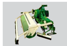
Kultivátor tvrdých ploch