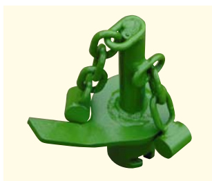
Řetězový čechrač na směs štěrku se solí