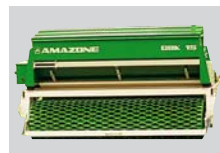
Široká secí kombinace pro výsev travy