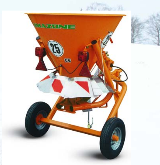
Rozmetadlo EK-S 260 s podvozkem a osvětlením (na přání i s přejímkou akreditovanou zkušební TUV).