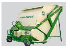
Žací stroj Grasshopper s výklopným vyprazdňováním zásobníku