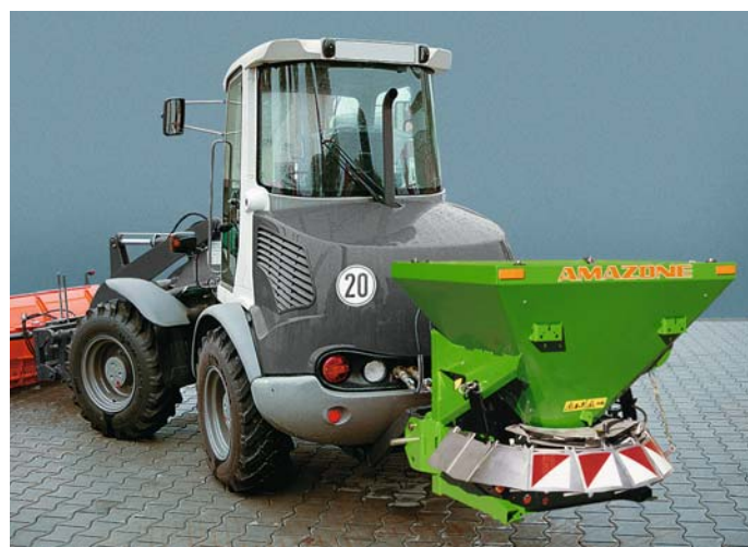
E+S SH: Pohon pomocí hydraulického motoru umožňuje např. práci s kolovým nakladačem.

Flexibilní koncept pohonu pracovního agregátu, kdy lze zvolit buď vývodový hřídel či hydraulický motor, otevírá možnosti pro různé oblasti použití tohoto rozmetadla.