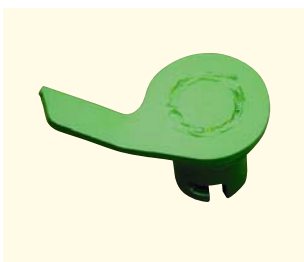
Čechrač na granulovaná hnojiva