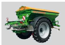
Velkoplošné rozmetadlo písku ZG-B